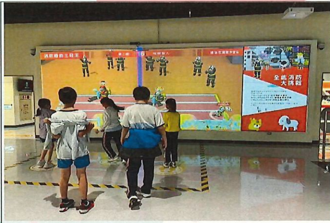
說明：學生體驗全能消防大挑戰