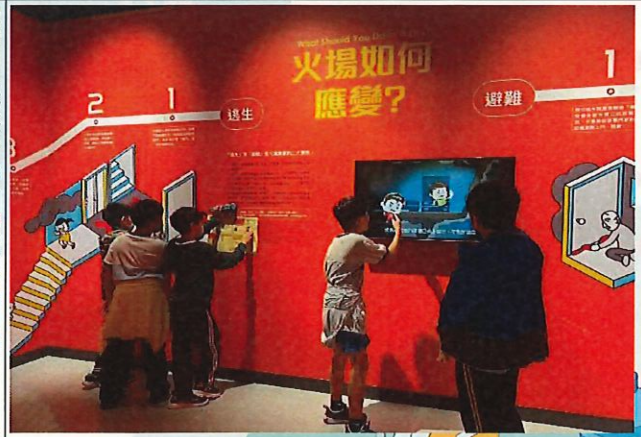
說明：學生體驗館內設施情形