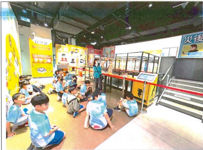
說明：透過專業導覽員提供深度學習