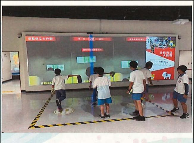
說明：學生體驗避難逃生大作戰