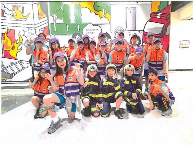
說明：學生身體驗穿著消防暨救護衣