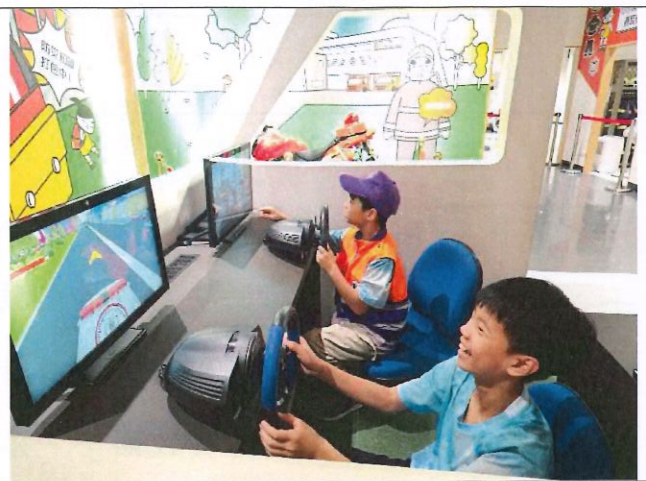
說明：透過 AR 虛擬環境進行闖關活動