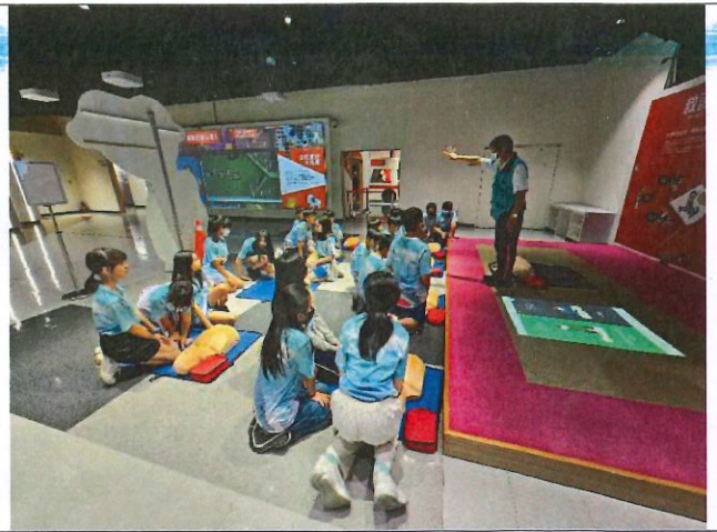
說明：讓學生操作與安妮進行 CPR&AED