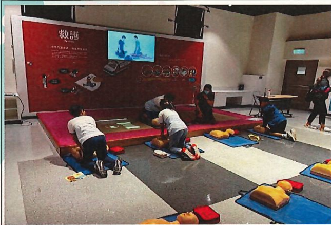
說明：學生體驗全能消防大挑戰