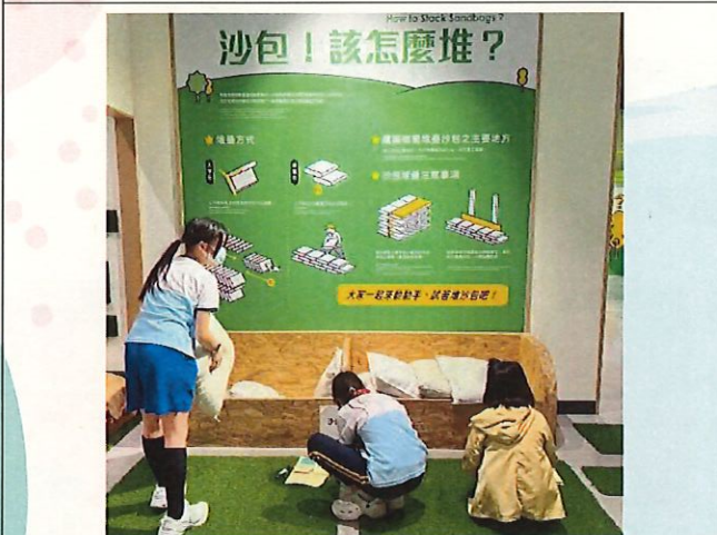
說明：學生體驗沙包如何堆法