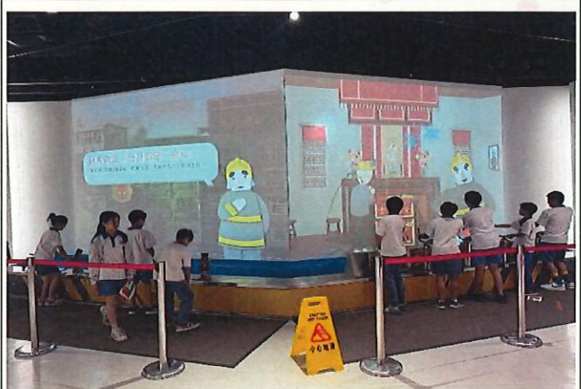
說明：學生體驗滅火挑戰