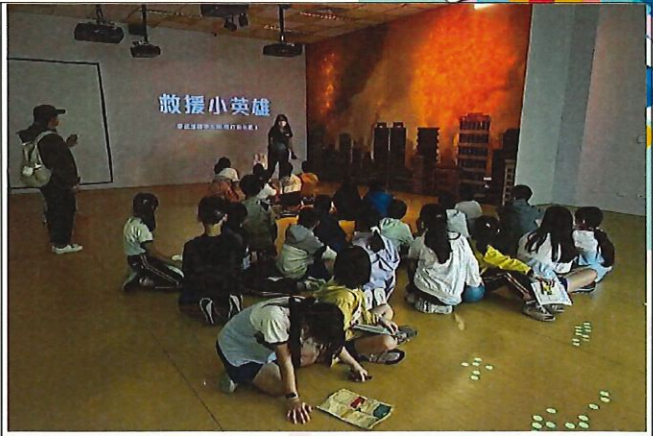
說明：學生體驗救援小英雄