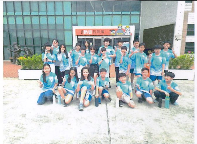
說明：完成防災館豐富學習意義之旅