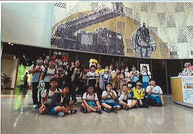
說明：學生參訪桃園防災館