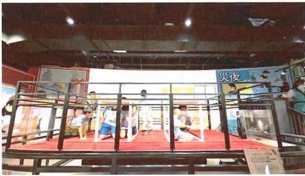
說明：體驗地震平臺操演趴掩穩步驟