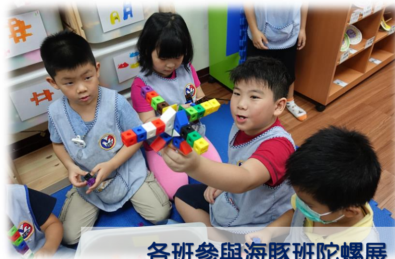
各班參與海豚班陀螺展