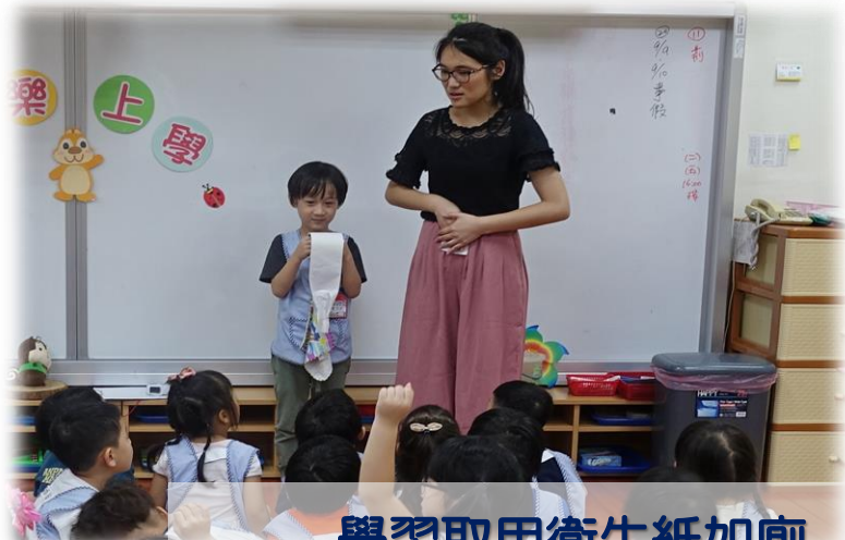
學習取用衛生紙如廁