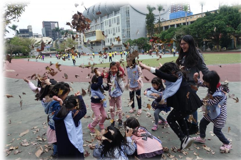
秋冬限定的落葉煙火