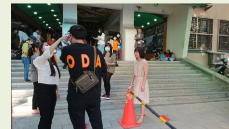
放學進出動線分流，避免群聚