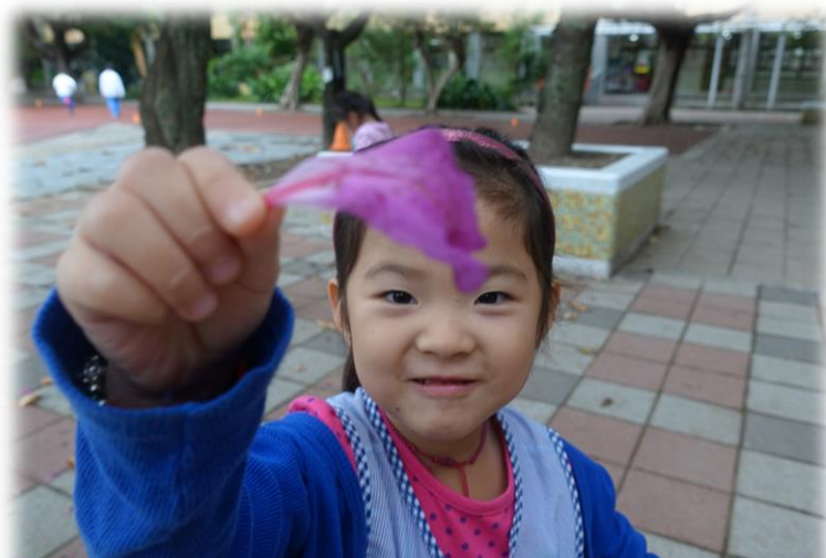
發現美麗的艷紫荊花瓣