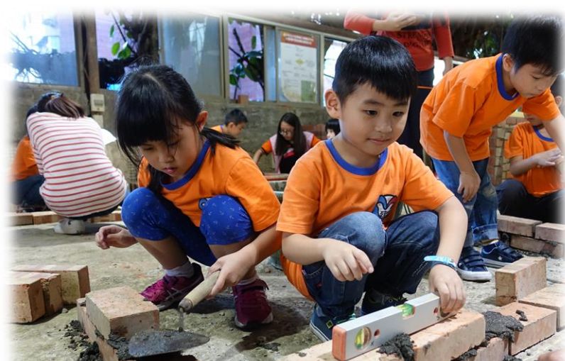
小小建築師主題：參訪大安高工