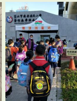
幼生及家長入校量額溫、戴口罩