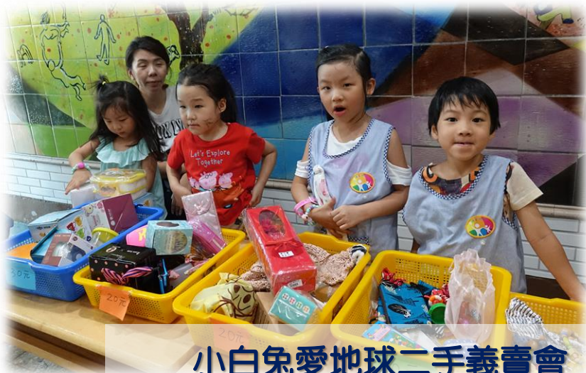
小白兔愛地球二手義賣會