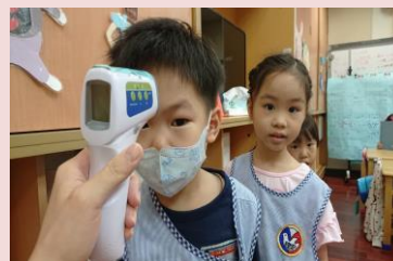
每日兩次測量額溫