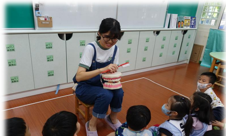
我會把牙齒刷乾淨