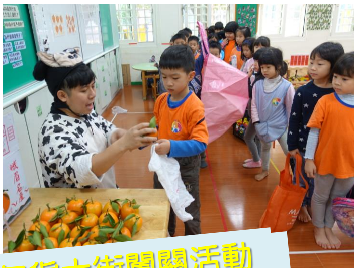
年貨大街闖關活動