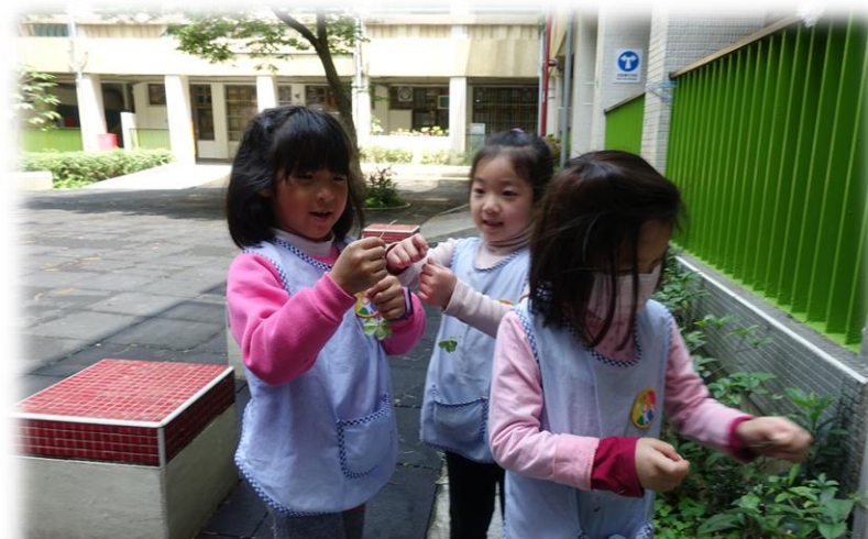
好玩的醉醬草拔河遊戲