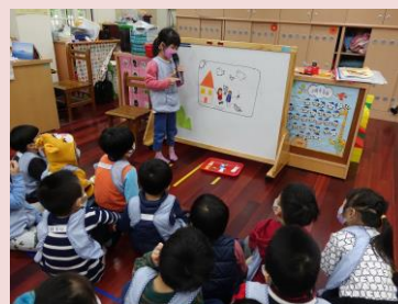
課室活動配戴口罩