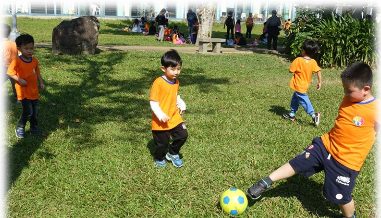
大湖公園野餐、運動