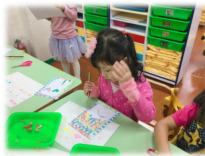
版畫-紙膠帶蓋印畫