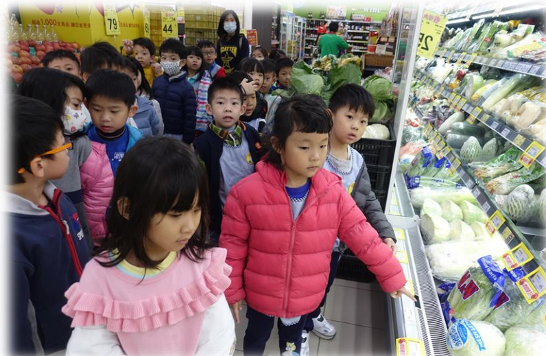
節慶教學：配合年節圍爐體驗採購