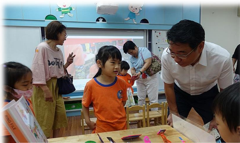
陀螺義賣所得捐助燒燙傷基金會