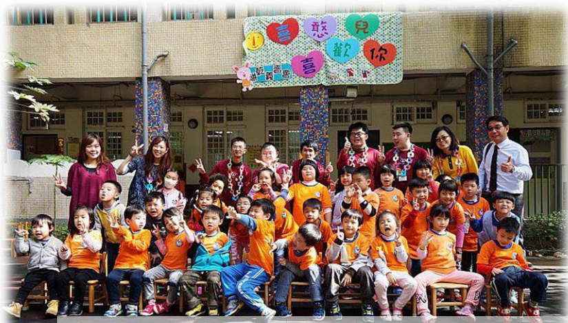
喜憨兒喜歡你愛心義賣會