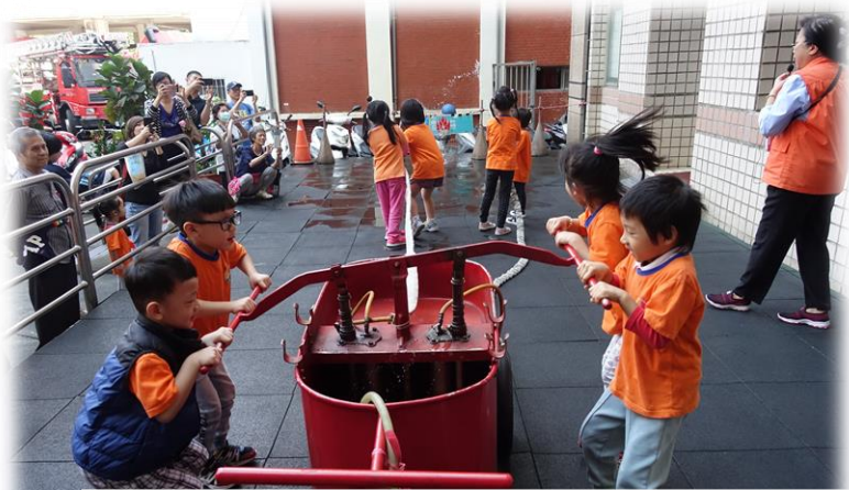
內湖防災科學教育館