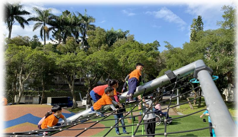
探索特色公園-萬芳四號公園