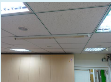
日間：次氯酸霧化機