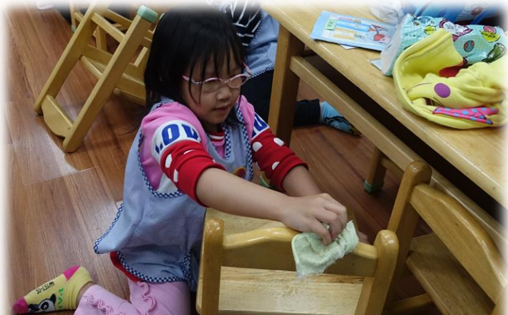
自己擦拭清潔桌椅