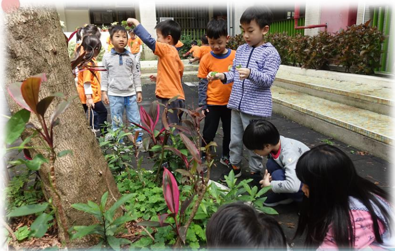
一年四季都不同的樂樹