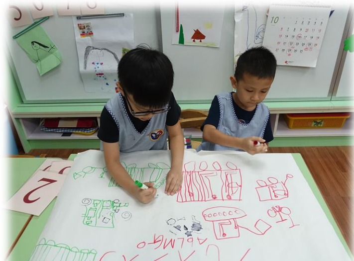
線畫-工作中的車子