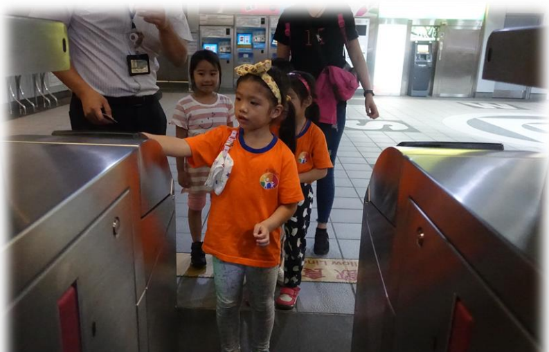
臺北101主題：參觀大安捷運站