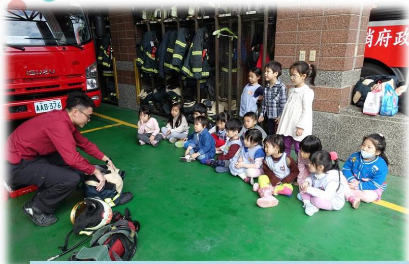
安全教育：參訪消防局復興分隊